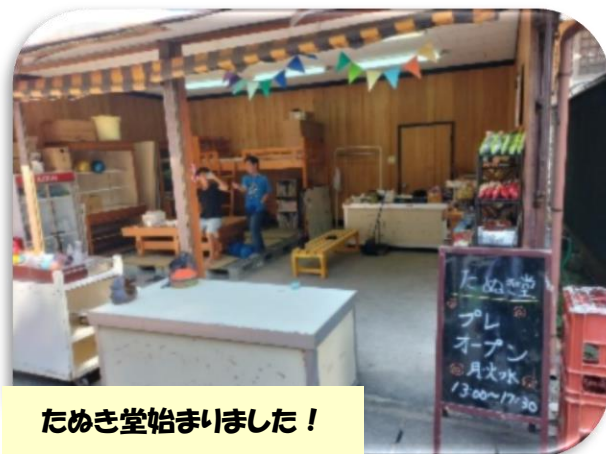
たぬき堂始まりました！